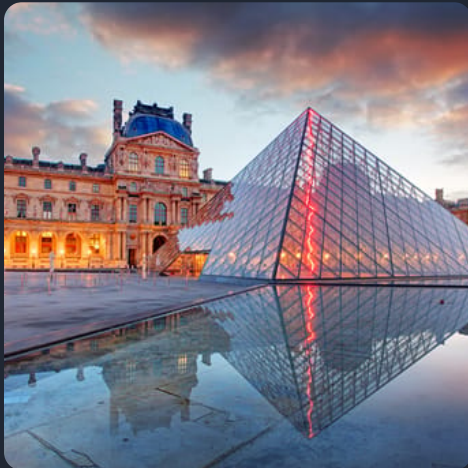
Museos y Monumentos

A lo largo de los siglos, Francia ha destacado en campos como la literatura, la gastronomía o las artes. Es fácil darse cuenta de cómo se ha plasmado en el idioma. Se trata, como el español, de una lengua proveniente del latín, repleta de historia y sobre todo, de una desbordante cultura.